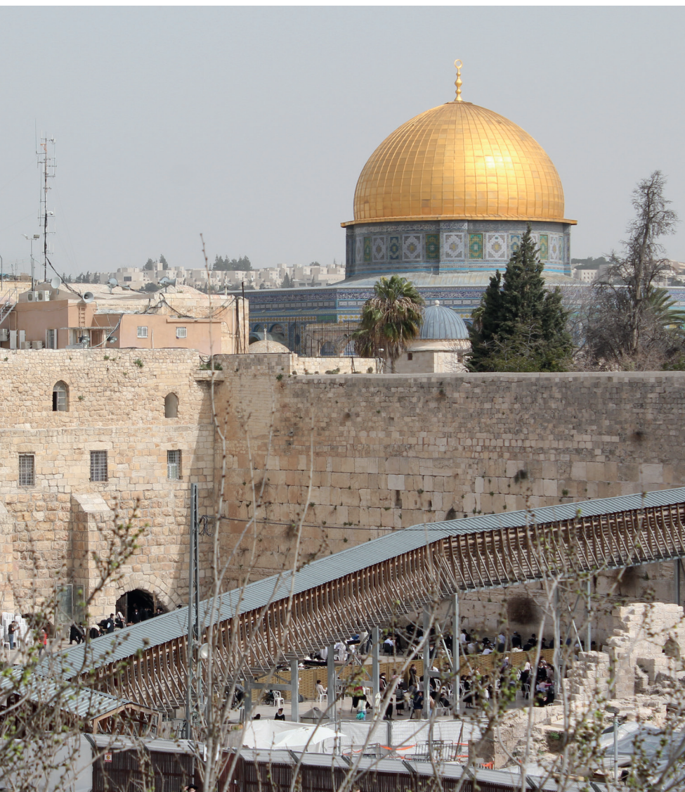
Blick auf den Tempelberg: Im Vordergrund die Klagemauer, im Hintergrund auf dem Hochplateau die Al Aqsa Moschee

die eine zivilgesellschaftliche Bewegung gewaltfreien Widerstandes ist, sollen öffentliche Räume und Unterstützung entzogen werden. Fast panische Reaktionen öffentlicher und kirchlicher Häuser führen bei dem Thema zu einem Verlust an öffentlicher Diskurskultur und Meinungsfreiheit, zumal nach der Resolution des Deutschen Bundestages vom 17. Mai 2019 Gerichtsurteile deutlich machen, dass die Resolution keine Rechtskraft hat.