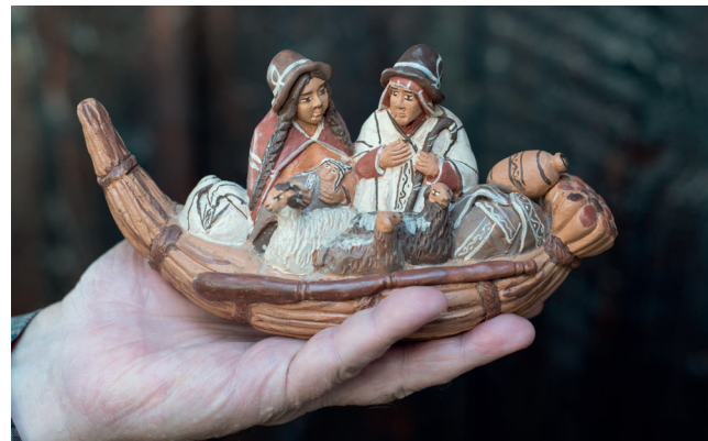
Beispiel für Inkulturation: Krippe auf einem Boot, Titicacasee, Peru

Gott kommt an. Bei Johannes heißt es „Er kam in sein Eigentum, aber die Seinen nahmen ihn nicht auf.“ (Joh 1,11) Einfache Bauern in Südamerika verstehen das so: Die Menschen nahmen ihn nicht auf, weil er arm war und weil er gegen die Ungerechtigkeit predigte. Bis heute haben ihn viele nicht aufgenommen. Das erleben sie in einer Gesellschaft voller Ungerechtigkeit, auch in der Kirche. Wer ihn aufnimmt – meinen sie – der verändert sein Leben und fängt an, das Gute zu tun. Gerade Menschen aus sogenannten Entwicklungsländern kennen Armut und Unterdrückung in der Kolonialgeschichte und heute. Sie erkennen die Solidarität Jesu mit den Leidenden und Armen.