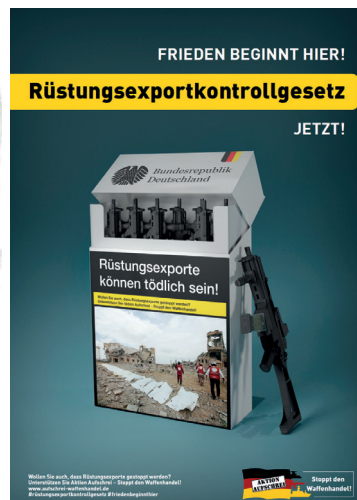
Briefaktion der Aktion Aufschrei an die Mitglieder des Deutschen Bundestages – Titelseite der dazugehörigen Informationsbroschüre