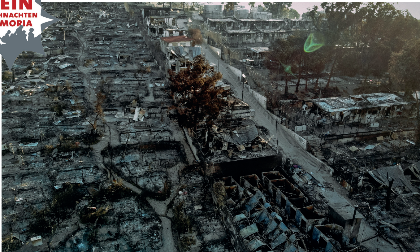
Ein Bild der Verwüstung: Das unbewohnbar gewordene Lager Moria auf der griechischen Insel Lesbos nach dem Brand im Spetember 2020

Auf Initiative von pax christi Rottenburg-Stuttgart und des Vorstands der Arbeitsgemeinschaft Katholischer Verbände und Organisationen in der Diözese Rottenburg-Stuttgart (ako) in Kooperation mit dem Diözesan-ausschuss Europa beschloss der Diözesanrat der Diözese Rottenburg-Stuttgart in seiner Sitzung am 25.09.2020 in Untermarchtal die Unterstützung und Mitträgerschaft der Kampagne „Kein Weihnachten In Moria. Notleidenden helfen – Geflüchtete aufnehmen. Jetzt!“