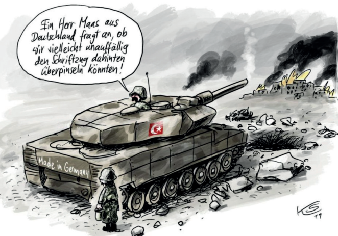
Karikaturist*innen gaben eine Reihe von Motiven für die Aktion Aufschrei frei – hier „Made in Germany“ von Klaus Stüttmann

Mit der aktuellen Diskussion um die Kampagne „Sicherheit neu denken“ (4) erhöht die Ev. Landeskirche Baden den Druck, die militärische Konfliktbearbeitung zu beenden. Für die inhaltliche