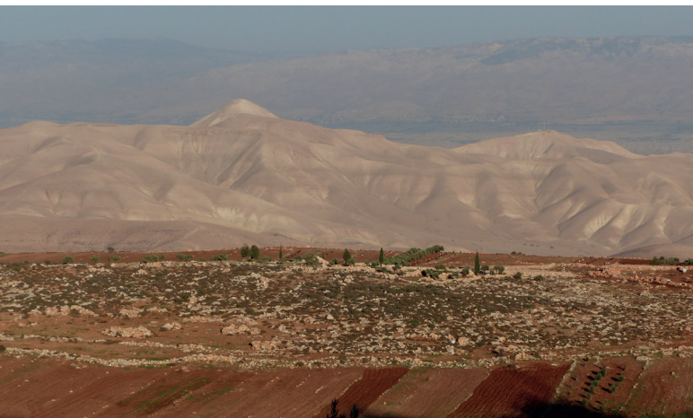
Blick auf dem Weg von Duma, nördliche Westbank ins Jordantal hinunter – den israelischen Plänen zufolge sollen große Teile des Jordantals annektiert werden

keit, Menschenrechte und Völkerrecht unermüdlich fortsetzen und sucht die Kirchen, die Regierung und die Öffentlichkeit dafür zu gewinnen. Der Diözesanverband bedauert, dass es im Diözesanrat bislang nicht möglich war, sich dem „Schrei nach