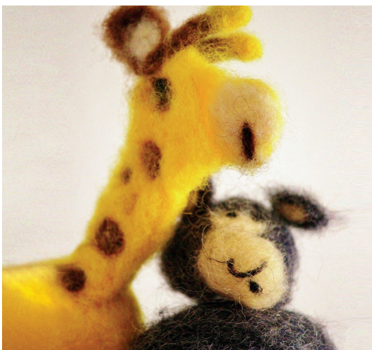
Giraffe und Wolf – zentrale Symboltiere im Konzept der gewaltfreien Kommunikation