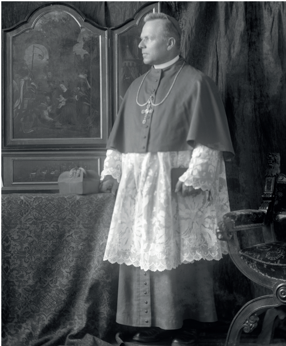
Joannes Baptista Sproll als Weihbischof