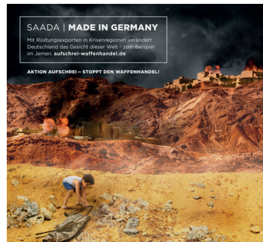
Motiv aus der Plakatkampagne „Made in Germany“ der Aktion Aufschrei 2019, u. a. in der Berliner U-Bahn

Dekanat, Friedensgruppen oder Betriebsräte als Kooperationspartner*innen anzufragen.