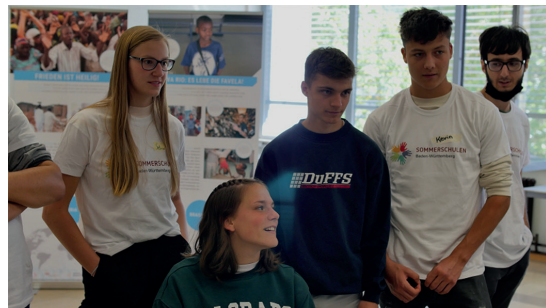
Schüler*innen während des Peace-Counts-Workshops mit der neuen Roll-up Ausstellung „Frieden machen – gelungene Beispiele aus aller Welt“ (im Hintergrund zu sehen und ausleihbar bei der Servicestelle Friedensbildung)

Bereits zum zweiten Mal führte die Servicestelle gemeinsam mit der Walther-Groz-Schule eine Sommerschule des Landes mit dem Schwerpunkt „Friedensbildung“ durch. Die Sommerschule fand in der letzten Woche der Sommerferien für rund 25 Schüler*innen der 11. Eingangsklassen statt. Themen waren u. a. Kommunikation und Frieden, Verschwörungstheorien und ihre Wirkung auf unser friedvolles Miteinander sowie zivile Friedensstrategien von Menschen weltweit, die auch in Kriegen und Konflikten kreative und gewaltfreie Wege zu Versöhnung und Konflikttransformation suchen. Konzept der Sommerschulen ist es, fördernden Unterricht in den Fächern Mathematik, Deutsch und Englisch mit lebensnahen Themen der Schüler*innen zu verbinden. Die Organisation der Sommerschule unter dem Eindruck von Corona hat allen Beteiligten eine Menge abverlangt. Aber, sie hat auch gezeigt, was möglich ist und wie Friedensbildung wirken kann. „Friedensbildung kann hier an der Schule sichtbar werden, indem man aktiv erzählt und aufmerksam macht, was wir hier in der Woche bei der Sommerschule erlebt haben.“, so eine Schülerin am Ende der Sommerschule.