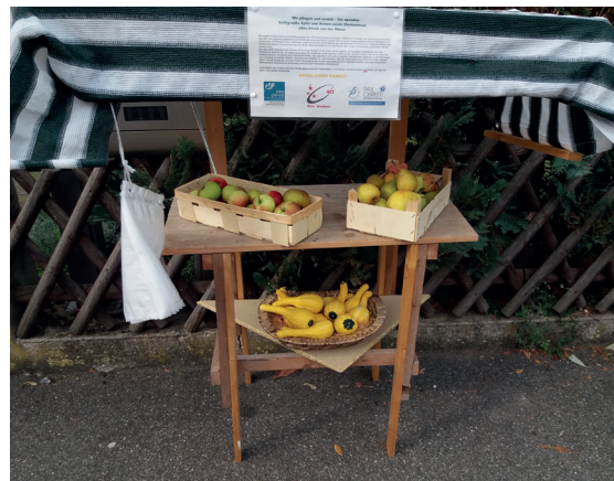
Ein einfacher Tisch auf dem Gehweg, Obst in der Auslage und eine knappe Information zum Nachlesen – fertig ist die kleine aber feine Spendensammelaktion

Nach dem Motto „Wir pflegen und ernten – Sie spenden“ wurden in Leinfelden an einem kleinen Verkaufsstand vor der Haustüre Äpfel und Birnen von der eigenen Obstwiese gegen eine Spende für die Bildungsarbeit des Arab Educational Institute (AEI) in Bethlehem angeboten. Ein kurzer Text informierte über das AEI und wies auf die langjährige Unterstützung durch pax christi hin.